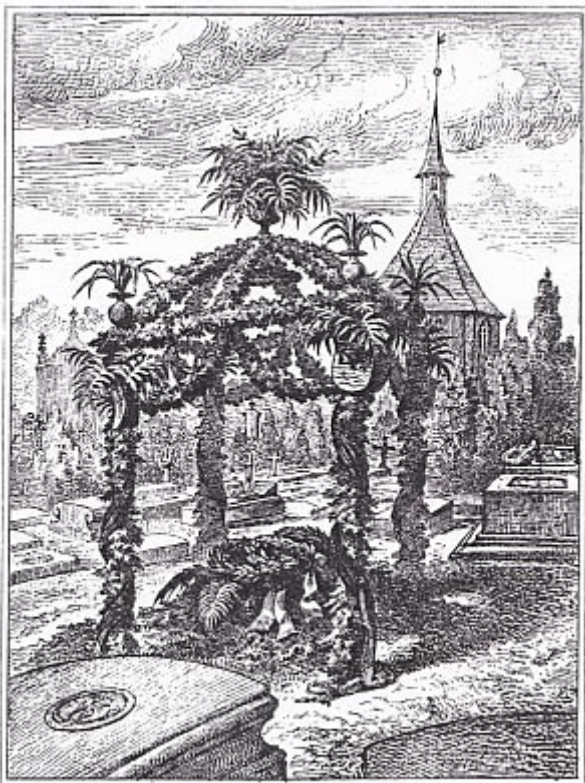
PHOTOLITHOGRAPHIE VON W. BILGE IN NÜRNBERG. ANSELM FEUERBACH'S GRAB.

Näheres zu den beiden Potraits im Text S. 75 unten und S. 76 oben