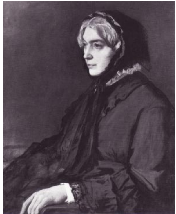
Henriette Feuerbach (Portrait 1878)

Näheres zu den beiden Potraits im Text S. 75 unten und S. 76 oben