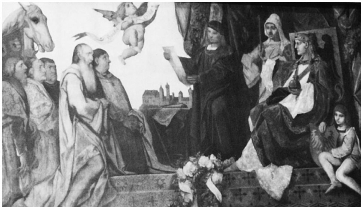
Die Wandbemalung der Industrie- und Handelskammer Nürnberg von Anselm Feuerbach aus dem Jahr 1877. Thema: Verleihung von Handelsprivilegien an die Reichsstadt Nürnberg (linke Hälfte oben, rechte Hälfte unten, dort im Hintergrund die Nürnberger Burg; siehe dazu S. 73)